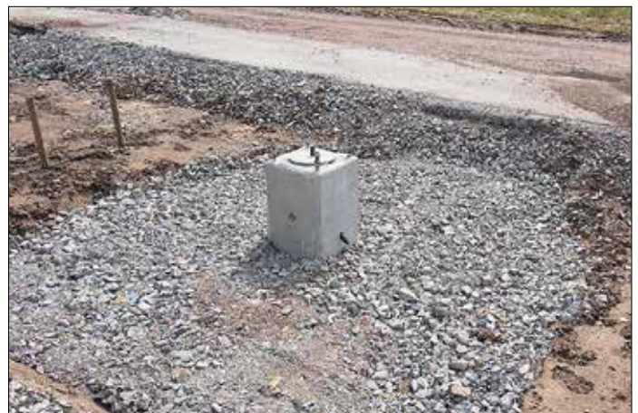
Nära Solbjer på den blivande spårvägssträckningen har de första fundamenten för kontaktledningstolparna kommit på plats.

Nu finns till och med en tydlig tracé från Solbjer ut över åkrar och