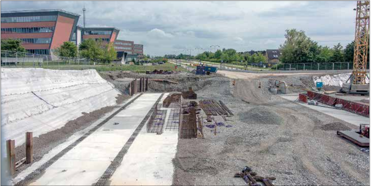
Här har just arbetet med den nya vägporten för Sölvegatan under motorväg E22 påbörjats. Den byggs vid sidan av själva passagen och ska skjutas in på plats när den är klar. Vägporten blir väsentligt högre och bredare än den lilla passage som finns idag.