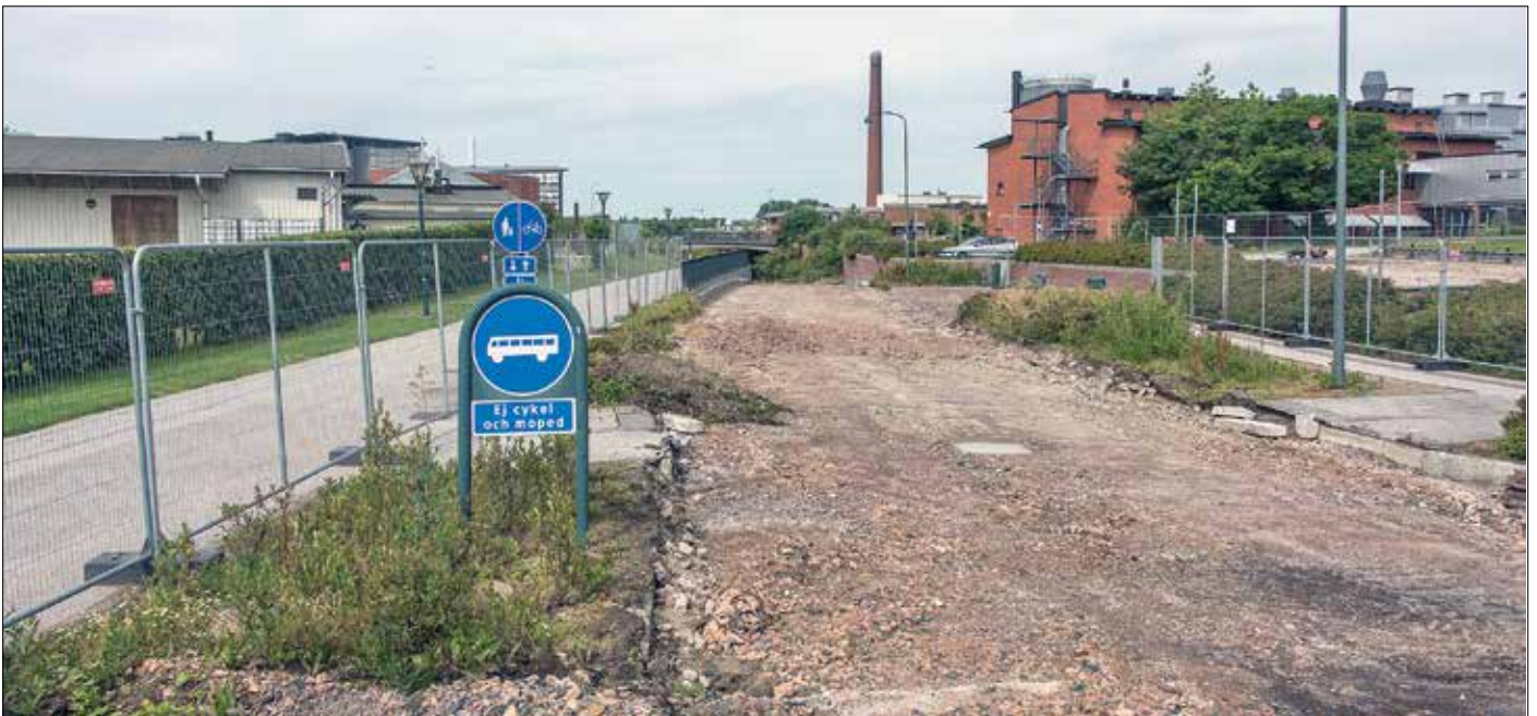
Bussbanan Lundalänken duger inte längre att köra bussar på.

ängar till Max IV. Men samtidigt kommer information om att trafikstarten blir förse- nad. Enligt ny tidplan kan spårvägstrafiken starta först våren 2020 i stället för som pla- nerat i september 2019.