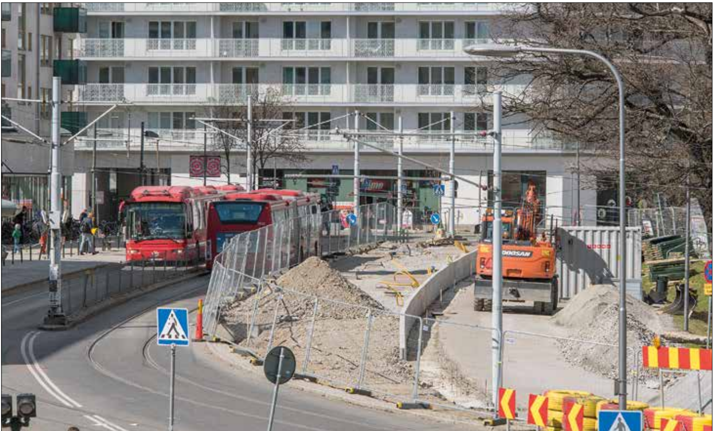
Vid Liljeholmen breddas plattformen för norrspår (till höger). Den får nu till synes rejäla dimensioner. På bilden även två mötande ersättningsbussar.