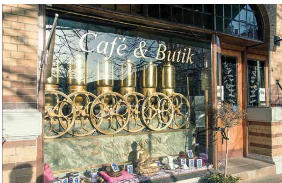
För kaffeälskare är helsingborgsbaserade Zoéga ett kultbegrepp. På Drottninggatan i centrum finns denna Zoégabutik, med klassisk apparatur i skyltfönstret.

danska kronor. Den får 28 hållplatser och ska trafikeras av 27 spårvagnar, som alla ska vara i läggolvsutförande, i 2,65 me-