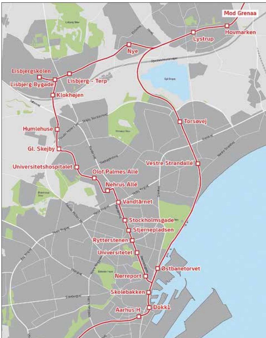
Den centrala linjekartan visar att den nya sträckningen (röd linje till vänster) går från Århus H till Lystrup och består av 12 km ny spåranläggning.

Det levereras en vagn varannan månad från Stadlers fabrik i Schweiz. Vagntypen finns bland annat på Rhônexpress i Lyon och i Stuttgart. Stadler och experter från både Aarhus Letbane och trafikoperatören Midttrafik samarbetar nära för att säkra kvaliteten på fordonen.