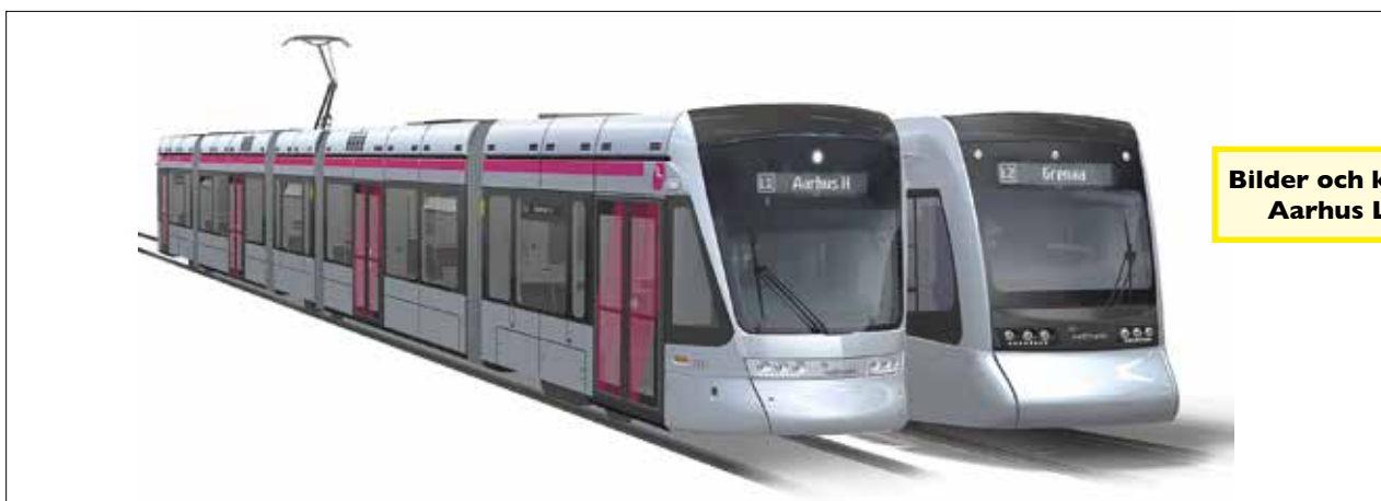
Bilder och kartor från Aarhus Letbane

Det nya spårssystemet får sammanlagt 50 hållplatser. Grenaabanen och Odderbanen är tidigare lokaljärnvägar vars nuvarande stationer behålls. Därtill kommer dock 17 nya hållplatser på den nya sträckan in till Århus. □