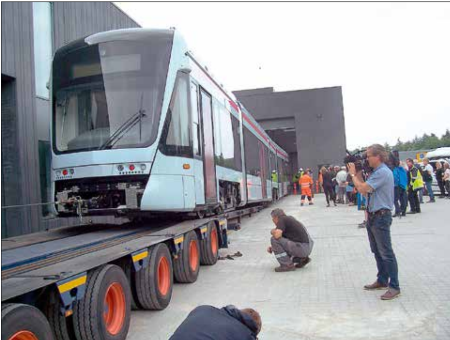
Undrar om det går? Processen följdes noggrant av bland annat pressens representanter när den första spårvagnen togs ned på spåren i Århus.

kostnadseffektiva och miljövänliga sätt. Passagerarna kommer att få uppleva en behaglig och säker resa, med angenämt inre klimat, wifi-anslutning, hög medelhastighet