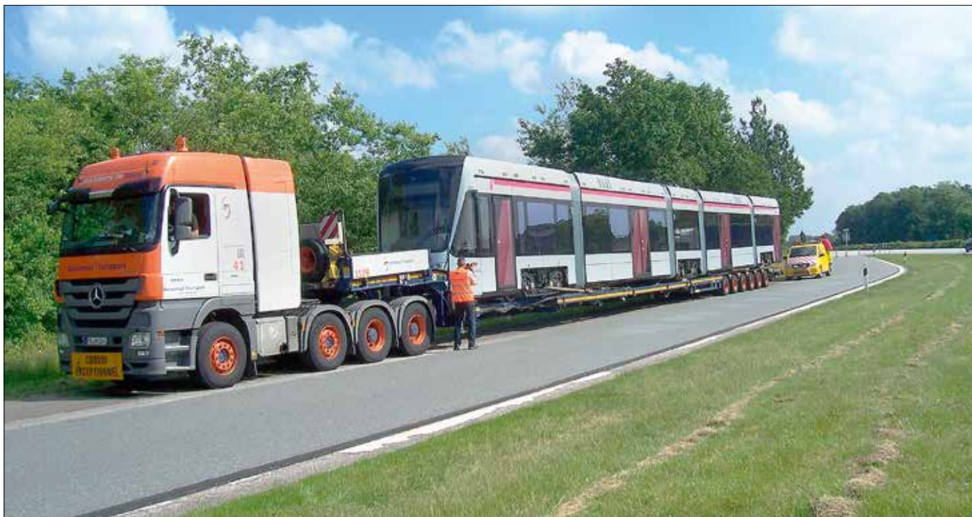
Den första nya spårvagnen transporterades på maskintrailer direkt från Stadlers fabrik i Berlin till Århus den 22 juni 2016.