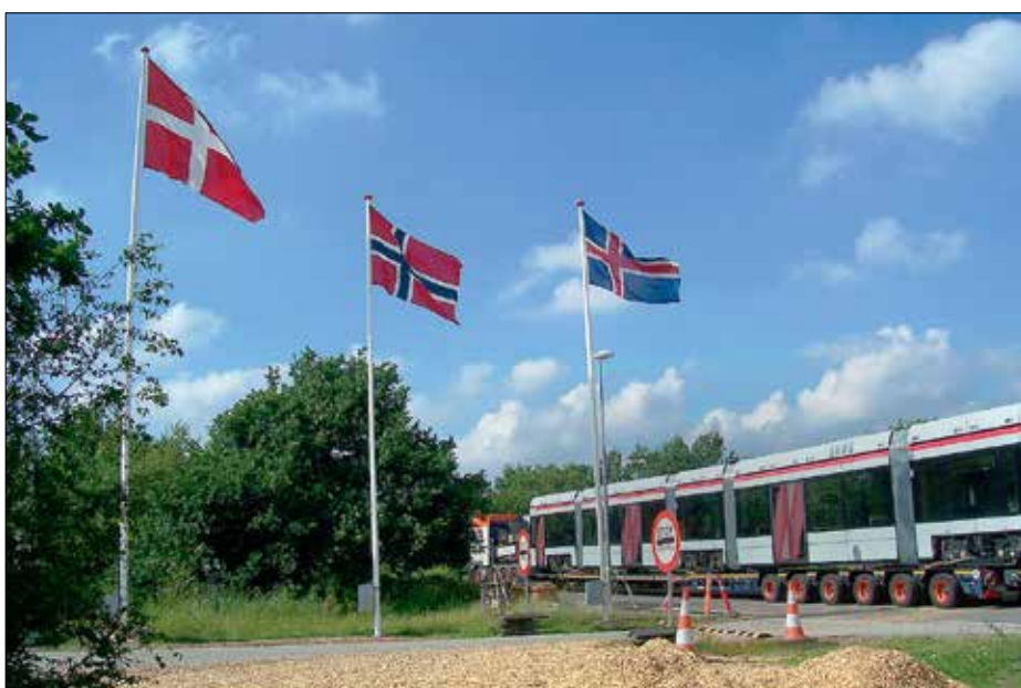
Här passerar vagntransporten den tysk-danska gränsen.

Ja, letbanen kommer att i hela Östjylland påverka stadsutvecklingen på mest