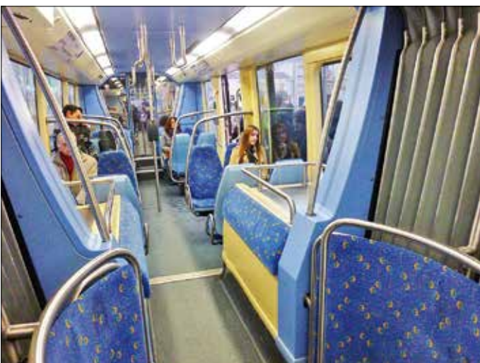
Stora hjulhus kännetecknar TVR, som i alla låggolvsbussar.