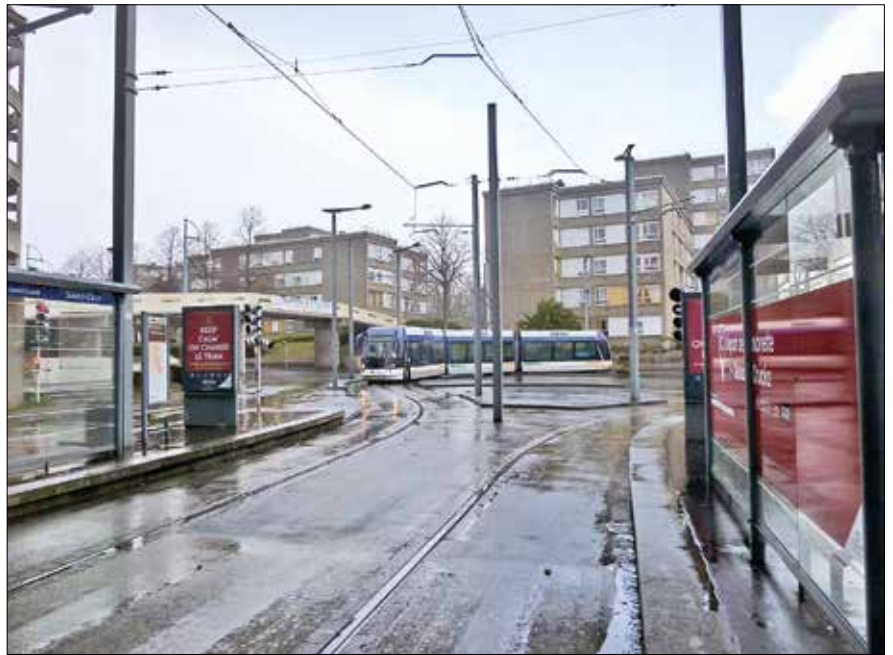
TVR är i både Caen och Nancy enriktningsfordon, alltså krävs vändslingor.