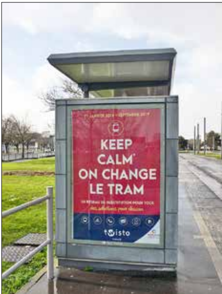
"Ta det lugnt, spårvägen förändras" är den ungefärliga betydelsen av anslaget på hållplatsen.