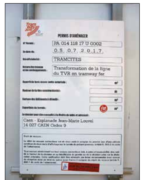
Här visas tydligt på anslag för allmänheten att arbetsplatsen har vederbörligt tillstånd. Arbetet består i att omvandla TVR-linjen till spårväg.