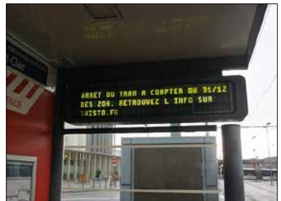
Informationskyltar i väntskydden anger att spårvägstrafiken upphör den 31 december kl 20.00.