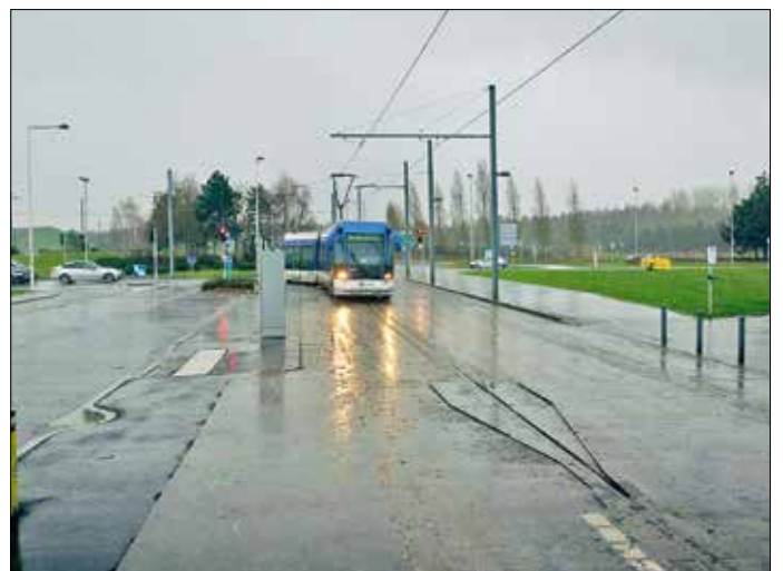
I körbanan syns en trattliknande anordning som används när TVR-fordonen ska övergå i spårstyrd trafik.