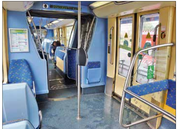
Vagnsbredden är 2,50 meter vilket ger förhållandevis gott om utrymme, men de stora hjulhusen och de trånga ledpartierna stjälar plats.