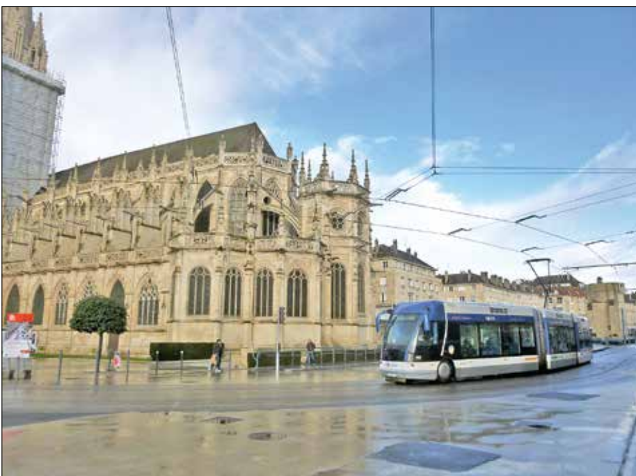
TVR-fordon rundar den stora kyrkan Église Saint-Pierre de Caen i centrum.