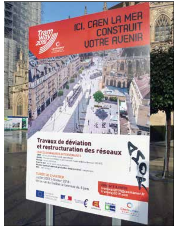
Skylt som informerar om det kommande arbetet med den nya spårvägen.