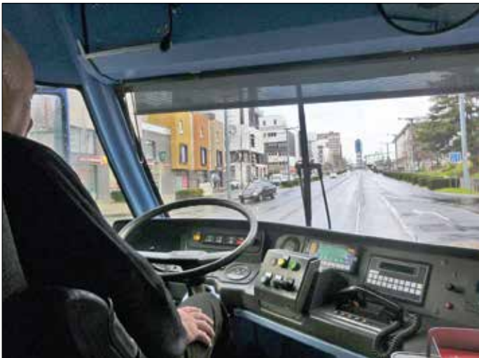
När TVR-fordonen körs spårstyrt ska man hålla händerna borta från ratten! Styrningen är alltid aktiv, och ratten snurrar av sig själv i kurvorna, så det är olämpligt att försöka styra "ur spår".