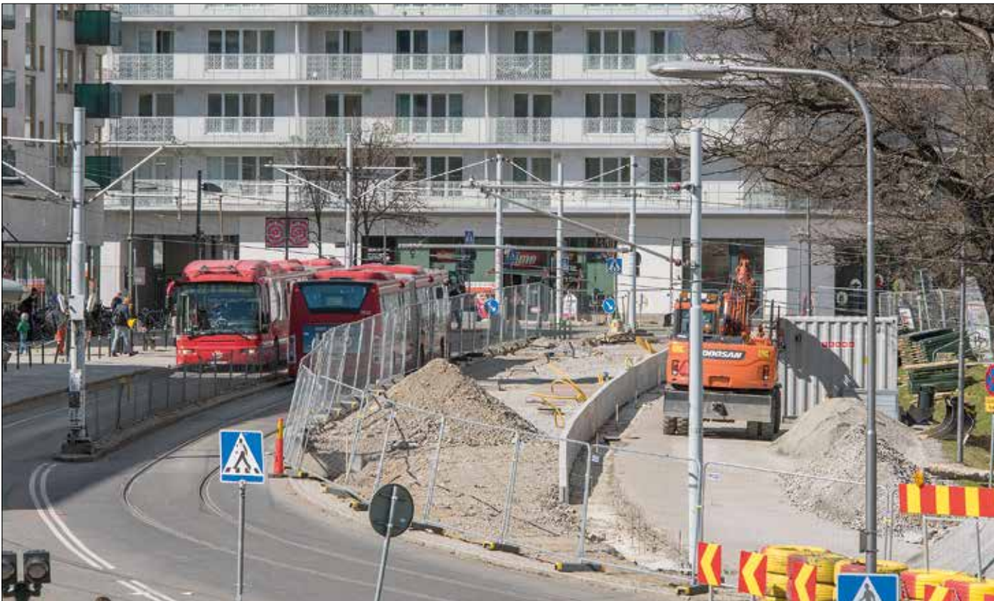
Vid Liljeholmen breddas plattformen för norrspår (till höger). Den får nu till synes rejäla dimensioner. På bilden även två mötande ersättningsbussar.