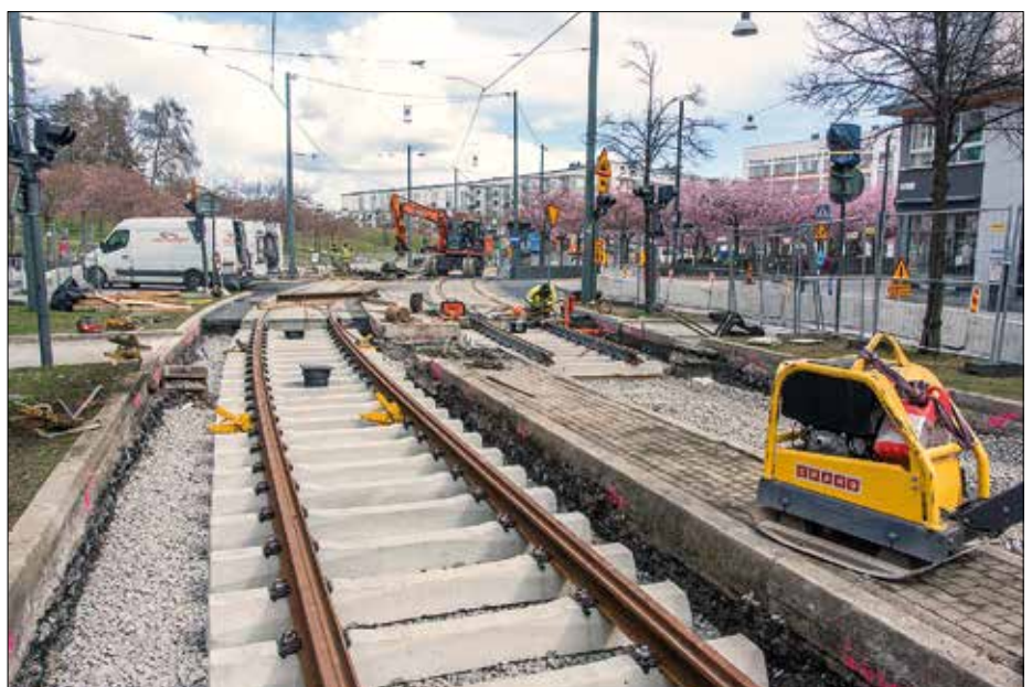
Spårläggning pågår nära hållplats Luma i Hammarby sjöstad.