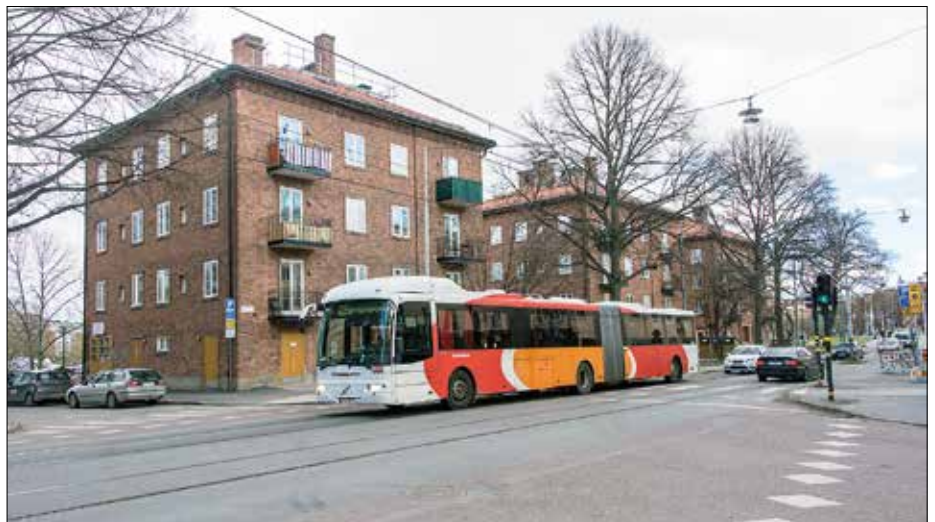
Bussarna som används i ersättningstrafiken har de mest skiftande ursprung.

Den röda linjen visar ersättningstrafikens synnerligen slingrande färdväg, att jämföra med Tvärbanans svarta linje. Restid mellan Sickla udde och Thorildsplan anges till 62 minuter. Förbindelsen Alvik-Alviks strand trafikeras med buss i halvtimmestrafik, ej längre med taxi som denna tidiga informationsbild anger. Illustration från trafikförvaltningen