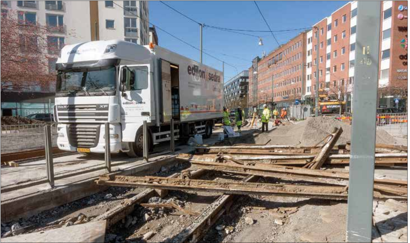
Vid hållplats Luma i Hammarby sjöstad har de ursprungliga spåren rivits upp och resterna syns i förgrunden. I bakgrunden kan anas att arbete med nya spår pågår. Edilon Sedra är på plats med arbetsfordon för inledande arbeten.