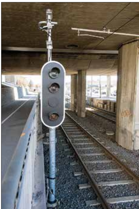
Nya signaler och antenner av olika slag för det nya signalsystemet kan nu monteras tämligen ostört vid den trafikfria banan.