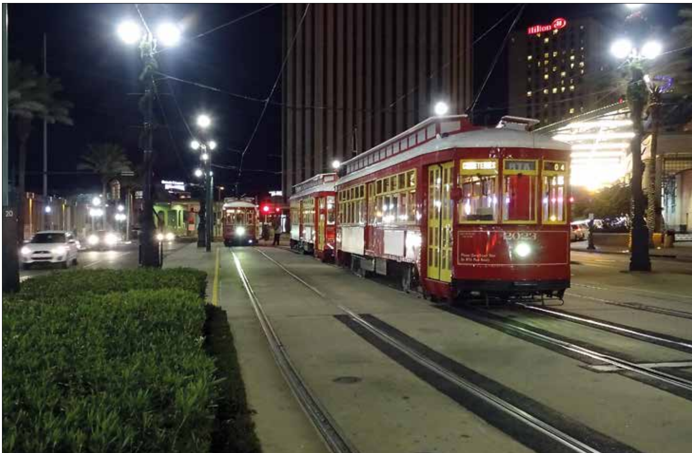
Ändhållplatsen innan Canal Street kommer fram till Mississippifloden.

engagerade politikers insatser. För ett halvsekel sedan pågick spår- vägsnedläggningarna för fullt.