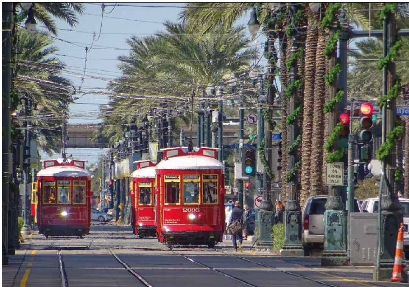
Livlig spårvagnstrafik på huvudgatan Canal Street i New Orleans. Samtliga vagnar på bilden är nybyggen som liknar vagnarna från 1920-talet.