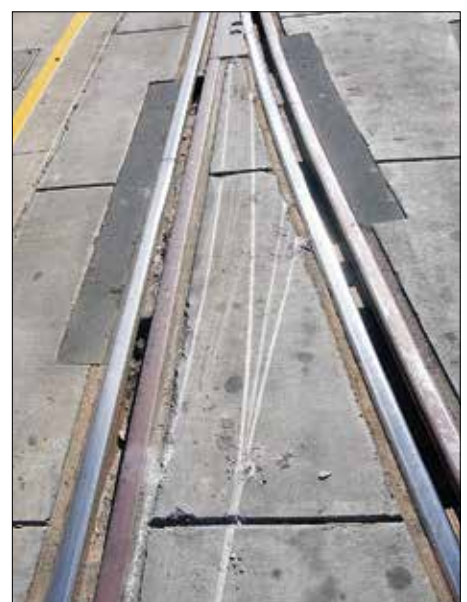
Spår vid sidan av spåren!