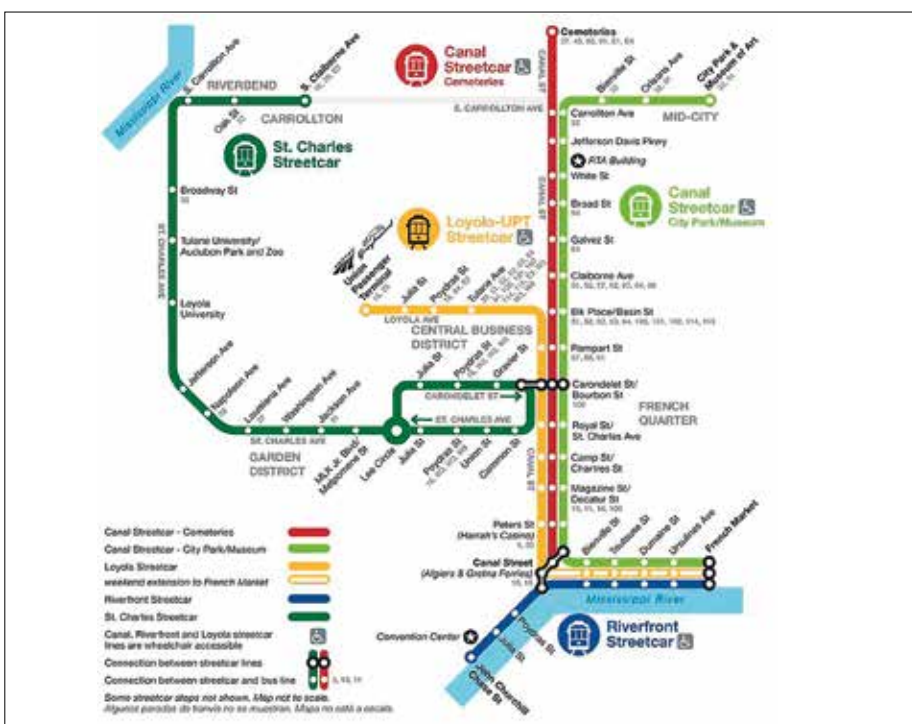
Karta över spårvägsnätet i New Orleans.