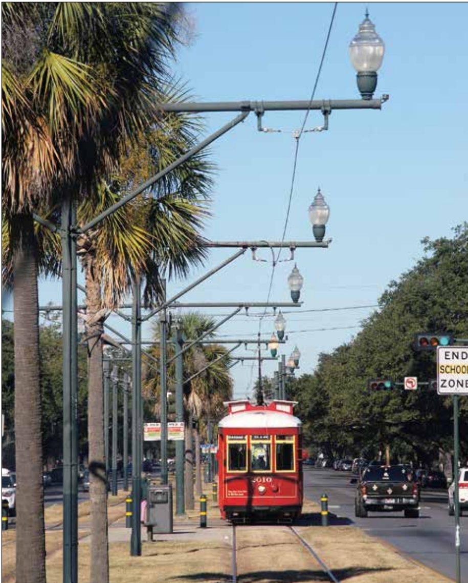
Bild från spårvägslinjen mot kyrkogården där gatubelysning och kontaktledding samverkar fint