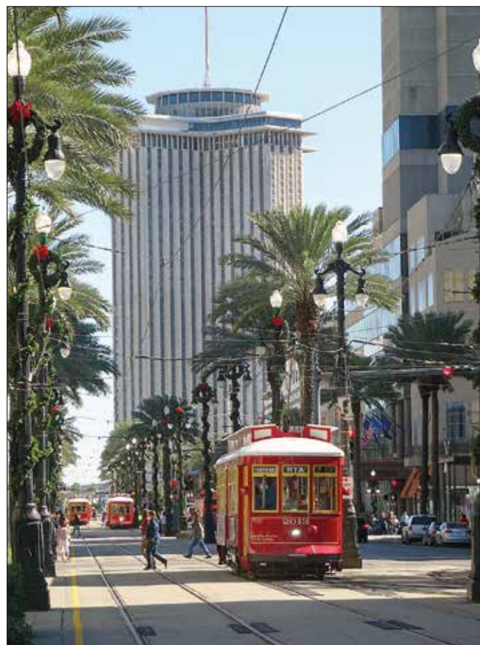
Spårvagnar på Canal Street; många av de höga husen är hotell och inte kontorskomplex.

Dessutom noterades växelproblem som tvingade vagnar till rang-