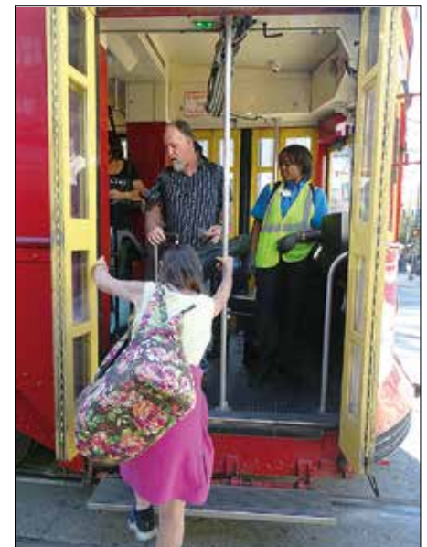
Högt insteg kännetecknar vagnarna i New Orleans. De flesta förare bär varselväst, bra när de måste ut och skifta spröt.