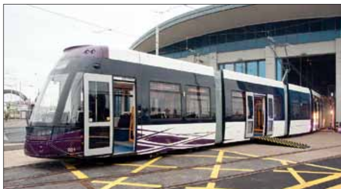
De nya spårvagnarna i Blackpool utgör utseende- och komfortmässigt en stor kontrast till de ålderdomliga vagnar som hittills har använts.

Den nya vagntypen kommer att sättas i passagerartrafik från april 2012.