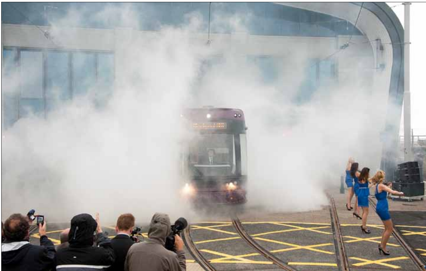
Bombardier Transportations nya spårvagnskonstruktion Flexity 2 premiärvisades den 8 september i Blackpool, vid den likaledes helt nya depån Starrgate.