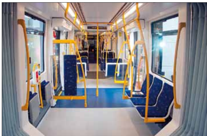
Flexity 2 för Blackpool har 74 sittplatser och plats för 148 stående, summa 222 passagerare. Det finns även multifunktionsytor, för exempelvis barnsvagnar och rullstolar, närmast i bild.