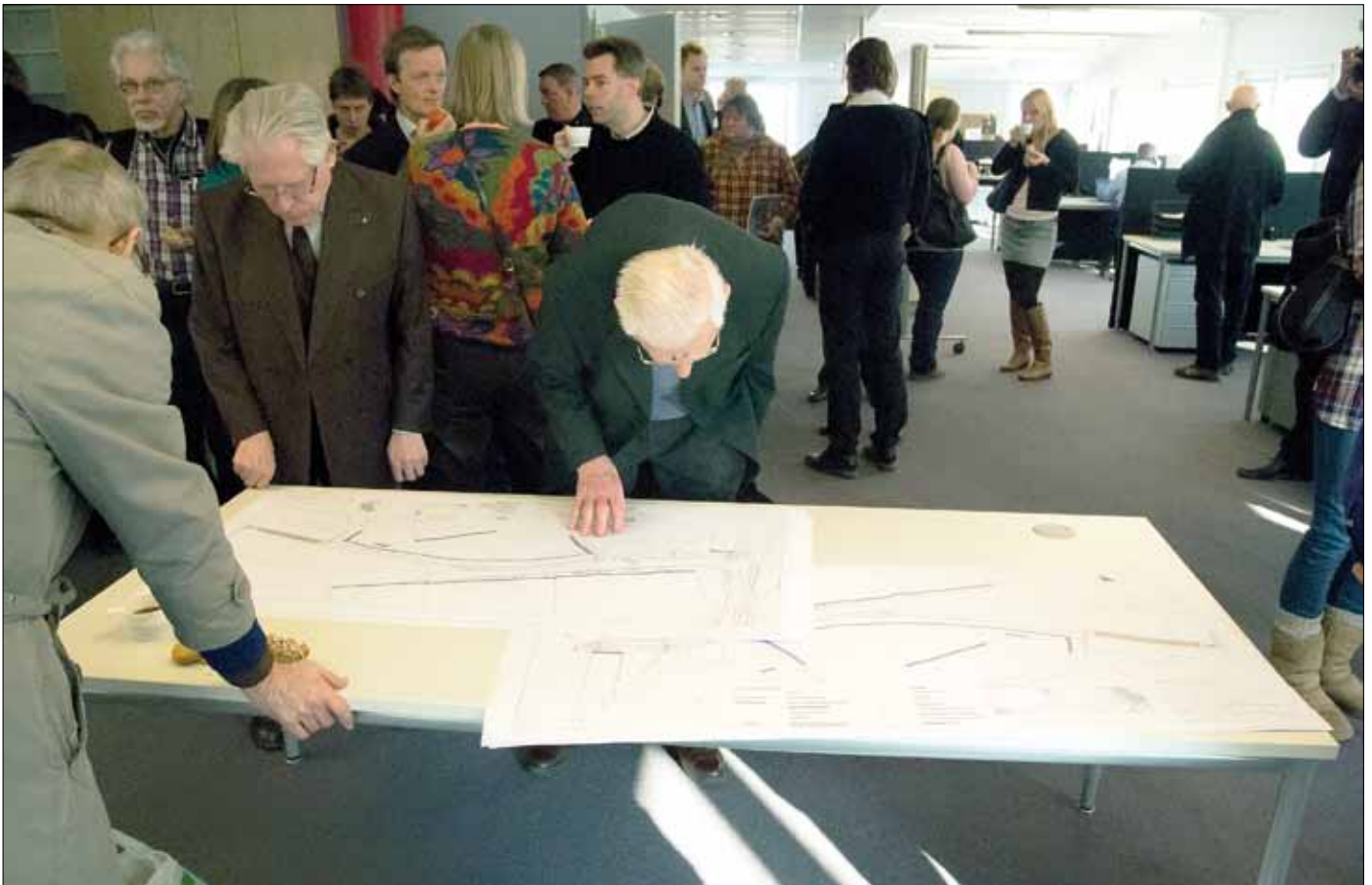
Vid samrådesmötet avseende utbyggnaden av Spårväg city i riktning Frihamnen, Värtan och Ropsten studerades det utställda materialet som synes med största intresse.

passagerarna. Dessa ska dock regleras av trafiksignaler för att hindra vänstersvängande bilar att störa passerande spårvagnar.